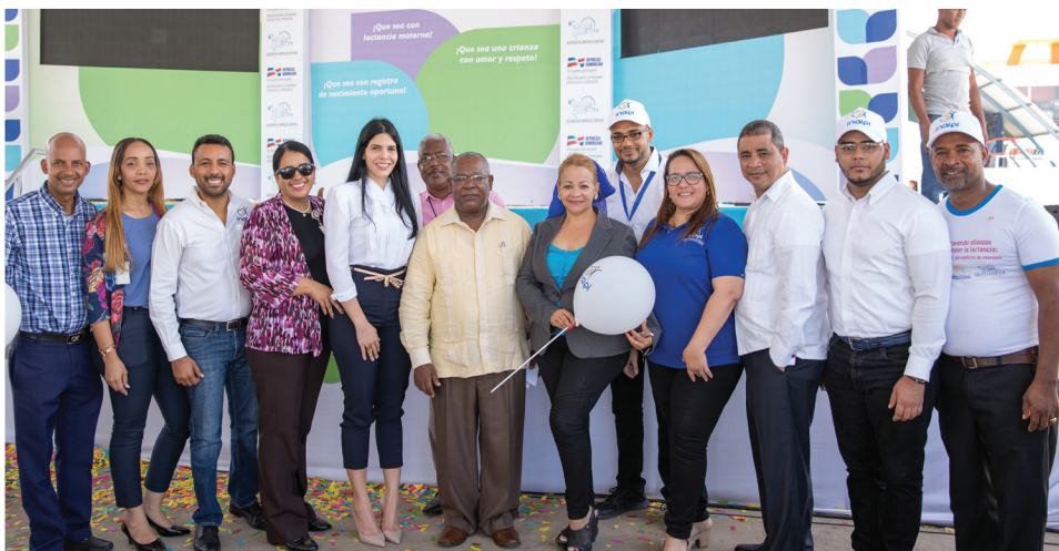
Equipo de funcionarios y técnicos del INAIPI que participó en la campaña “Primera Infancia...Inicio de la vida” que se efectuó en San Juan de la Maguana, el pasado 3 de agosto.

En el acto protocolar realizado en la plaza Francisco Alberto Caamaño Deñó se dieron a conocer las actividades de sensibilización y movilización social efectuadas durante todo el mes de