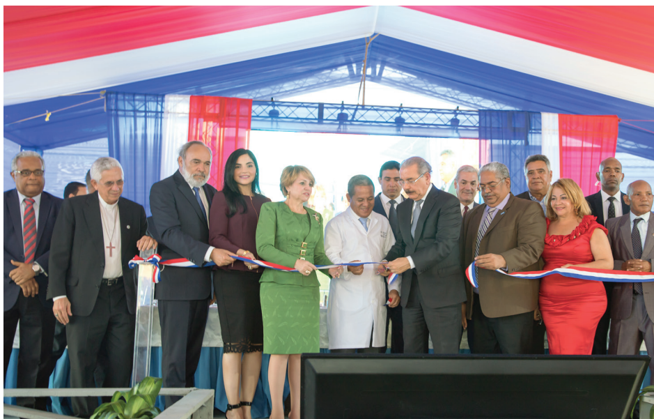
El presidente de la República, Danilo Medina, hace el corte de la cinta para dejar inauguradas las obras en la provincia de San Juan.

obra, que beneficiará a 226 niños y niñas, y sus familias, ya son 61 centros bajo este nuevo modelo en todo el territorio nacional.