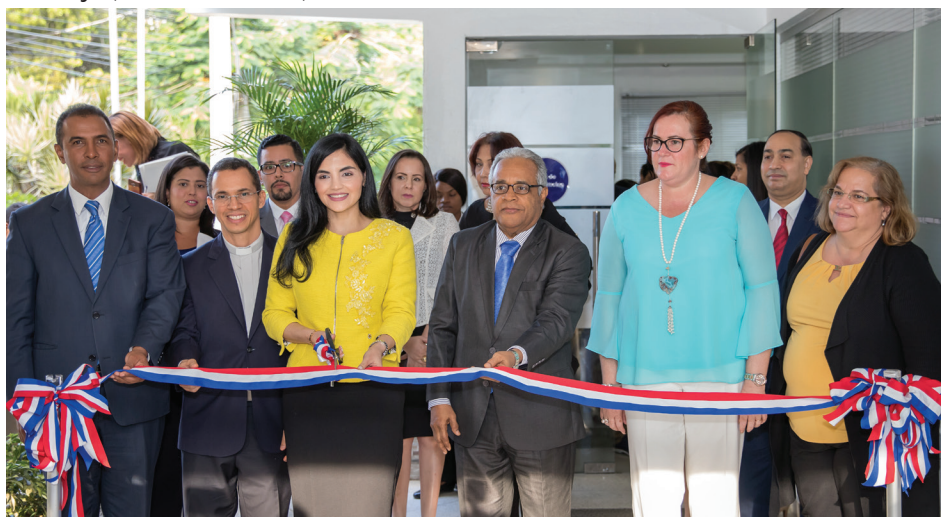
La directora del INAIPI, acompañada por el ministro de Salud Pública, la ministra de la Mujer y el Director General de DIGEPEP, hace el corte de cinta para la inauguración de la sala de lactancia de la Sede Central.

jaron inaugurada y totalmente equipada la "Sala Amiga de la Familia Lactante" de la sede central de la institución, la cual beneficiará a una decena de colaboradoras madres que en la actualidad están lactando.