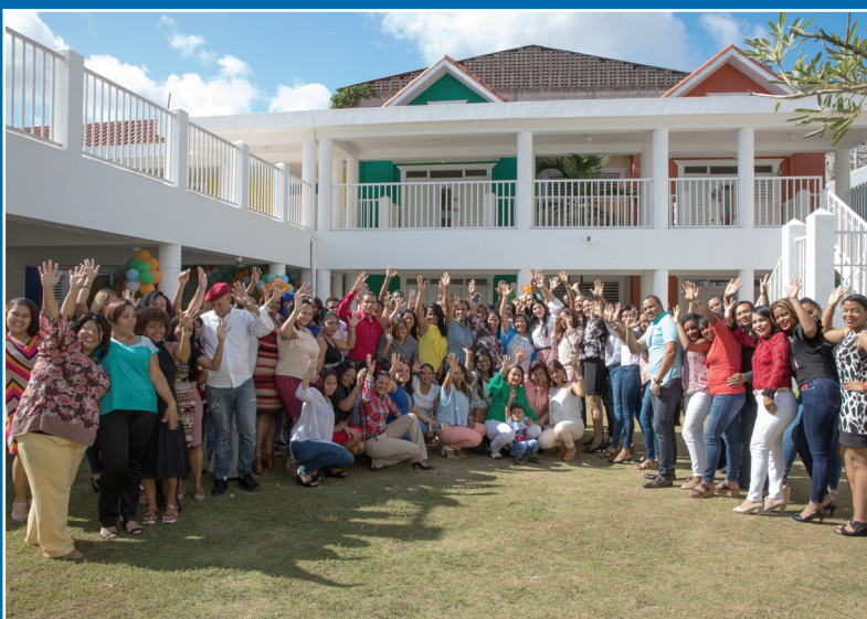
Colaboradores de la Red de Servicios Los Ríos, en el Distrito Nacional, disfrutaron su encuentro navideño.

En este encuentro además de degustar un típico almuerzo navideño, también fueron reconocidos con certificados los colaboradores que realizan su labor de manera sobresaliente al momento de cumplir su rol.