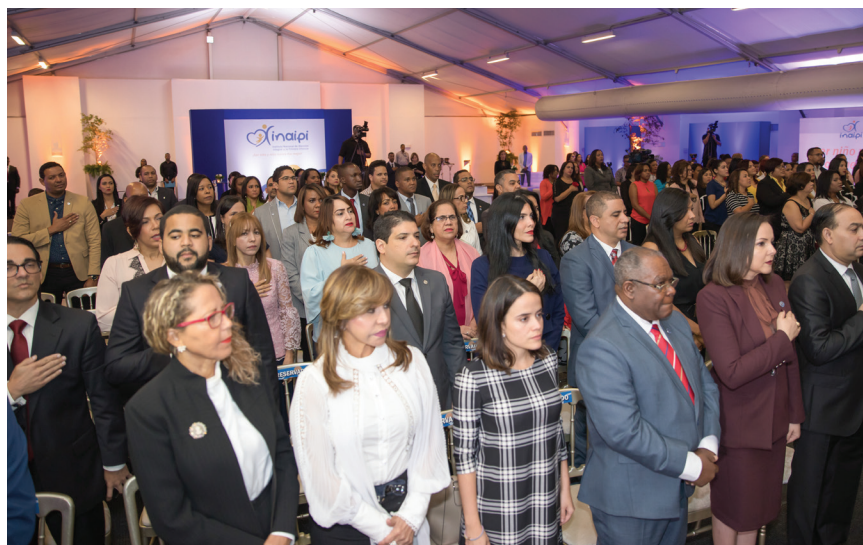
Vista parcial de los participantes en el acto de inauguración del Seminario.

sobre el estado actual y los avances de las políticas de atención y la garantía de derechos de la Primera Infancia en América Latina, a fin de asumir modelos de éxitos que puedan ser ejecutados en el país.