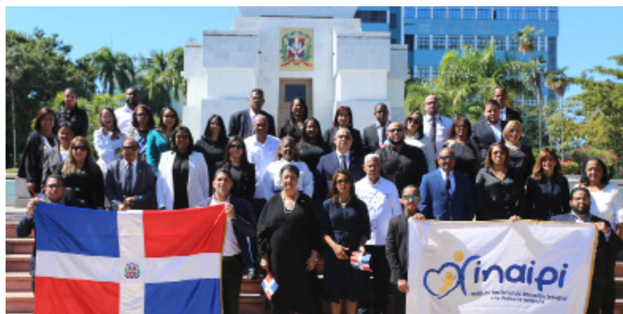
La institución depositó una ofrenda floral en el Altar de la Patria.