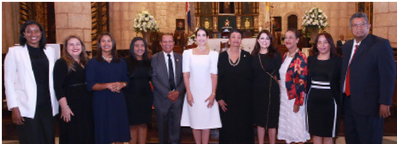
La primera dama Raquel Arbaje y la directora del INAIPI, Besaida Manola Santana, junto a otros ejecutivos de la institución, en la misa oficiada en la Catedral Primada de América, por el octavo aniversario del INAIPI.

En la celebración del octavo aniversario del Instituto Nacional de Atención Integral a la Primera Infancia, la directora ejecutiva Besaida Manola Santana, destacó entre los logros alcanzados por la institución, el fortalecimiento de las políticas en favor de los niños y de las niñas de 0 a 5 años de edad y la inclusión en el modelo de más de 200 mil infantes y sus familias, que reciben servicios de alta calidad.