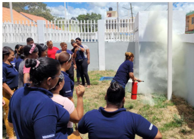
Personal del INAIPI mientras reciben entrenamiento del taller en “Primeros Auxilios Básicos”, que se realizaron a nivel nacional.

El Instituto Nacional de Atención Integral a la Primera Infancia (INAIPI), a través de la División de Seguridad Laboral, ha capacitado a mil 644 de sus colaboradoras y colaboradores sobre primeros auxilios básicos y en el uso de manejo de extintores para incendios.