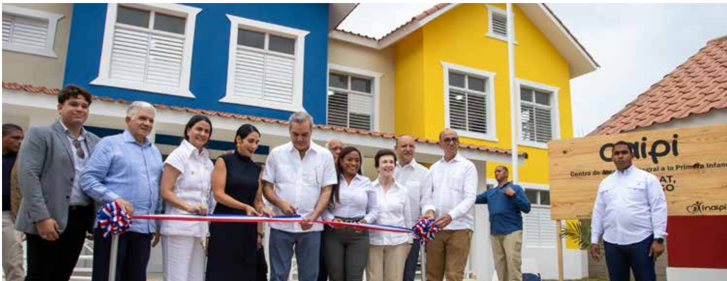
El presidente Luis Abinader al momento del corte de cinta del CAIPI Espailat, Santiago.