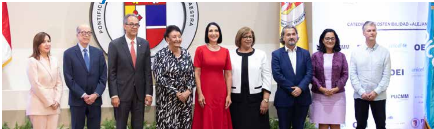
Las entidades organizadoras del cónclave buscan sensibilizar a los sectores sociales acerca de los impactos del cambio climático, especialmente en la primera infancia.

Con el objetivo de sensibilizar a los distintos sectores de la vida nacional acerca de los impactos del cambio climático, especialmente en la primera infancia, el Instituto Nacional de Atención Integral a la Primera Infancia (INAIFI), el Consejo Nacional para el Cambio Climático y Mecanismo de Desarrollo Limpio (CNCCMDL), la Cátedra de Sostenibilidad “Alejandro E. Grullón E.” de la Pontificia Universidad Católica Madre y Maestra (PUCMM), la Fundación Popular, el Fondo de Naciones Unidas para la Infancia y la Niñez (UNICEF) y la Organización de Estados Iberoamericanos (OEI), celebraron el primer “Foro Cambio Climático y su Impacto en la Primera Infancia”.