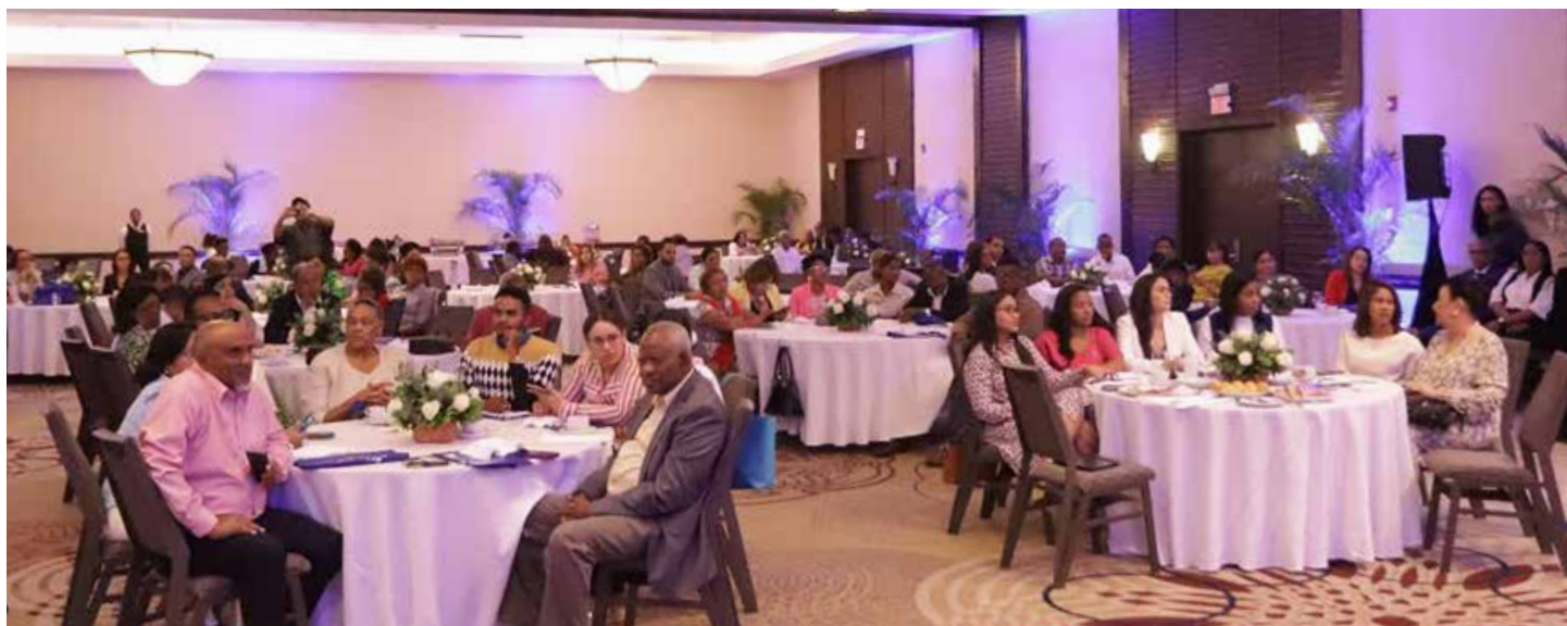
Parte del público asistente.