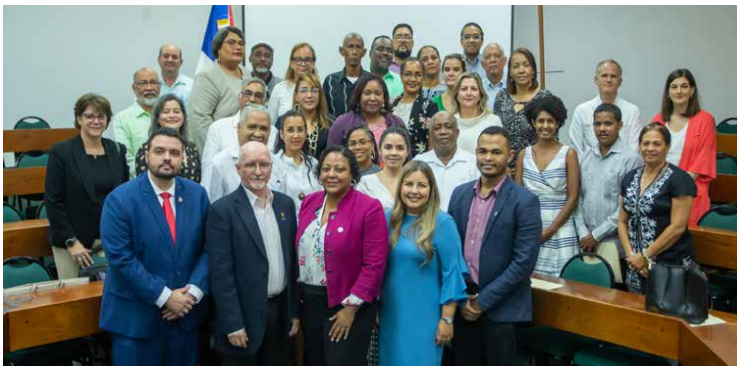
Organizaciones participantes en la actividad.