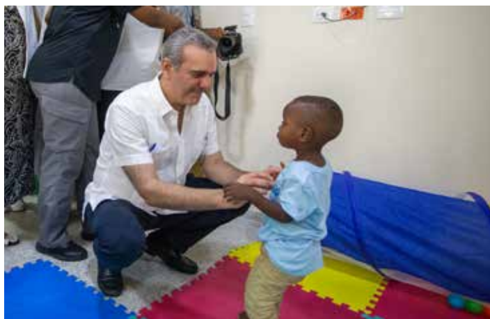
El presidente Luis Abinader comparte con un niño del CAIPI Villa Liberación.

Tres de los nuevos centros son del modelo CAIPI Comunitarios (CAIPI C), a través de los cuales reciben servicios 265 infantes de familias que viven en condiciones de vulnerabilidad en el