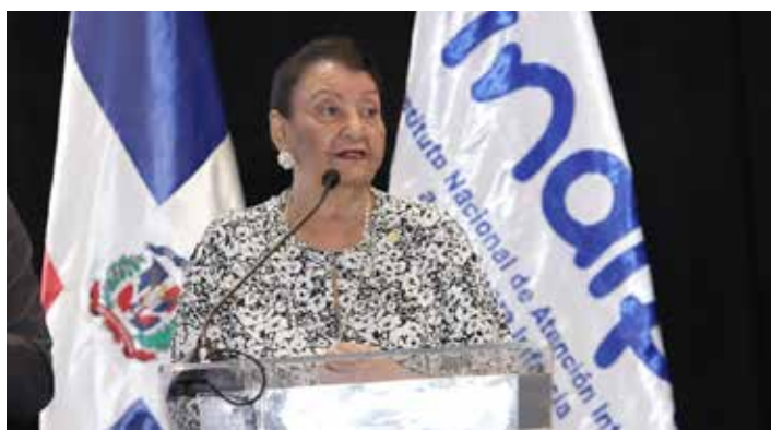
Besaida Manola Santana, Directora del Inaipi.

El Instituto Nacional de Atención Integral a la Primera Infancia (INAIPI) y las organizaciones de la sociedad civil que ofrecen servicios a nivel nacional en las diferentes modalidades de gestión, sostuvieron un encuentro para consolidar las alianzas estratégicas y continuar con el fortalecimiento de la calidad de los servicios.