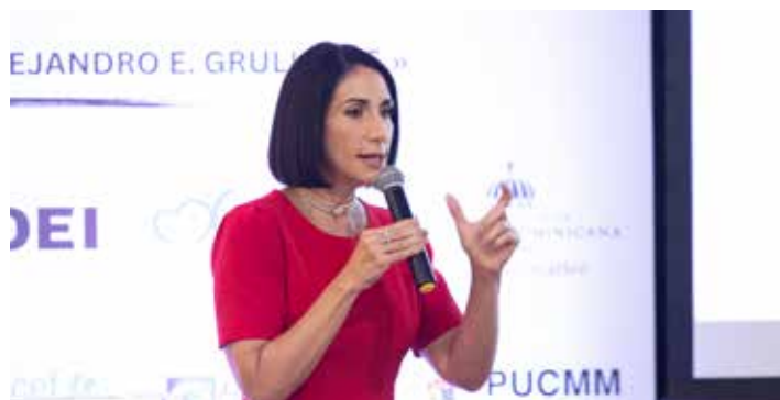
Raquel Arbaje, primera dama de la República.

Con el objetivo de sensibilizar a los distintos sectores de la vida nacional acerca de los impactos del cambio climático, especialmente en la primera infancia, el Instituto Nacional de Atención Integral a la Primera Infancia (INAIFI), el Consejo Nacional para el Cambio Climático y Mecanismo de Desarrollo Limpio (CNCCMDL), la Cátedra de Sostenibilidad “Alejandro E. Grullón E.” de la Pontificia Universidad Católica Madre y Maestra (PUCMM), la Fundación Popular, el Fondo de Naciones Unidas para la Infancia y la Niñez (UNICEF) y la Organización de Estados Iberoamericanos (OEI), celebraron el primer “Foro Cambio Climático y su Impacto en la Primera Infancia”.