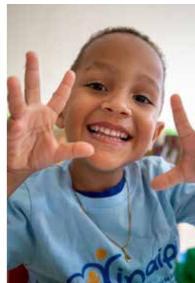
La primera dama Raquel Arbaje con un niño del CAIPI Espailat.