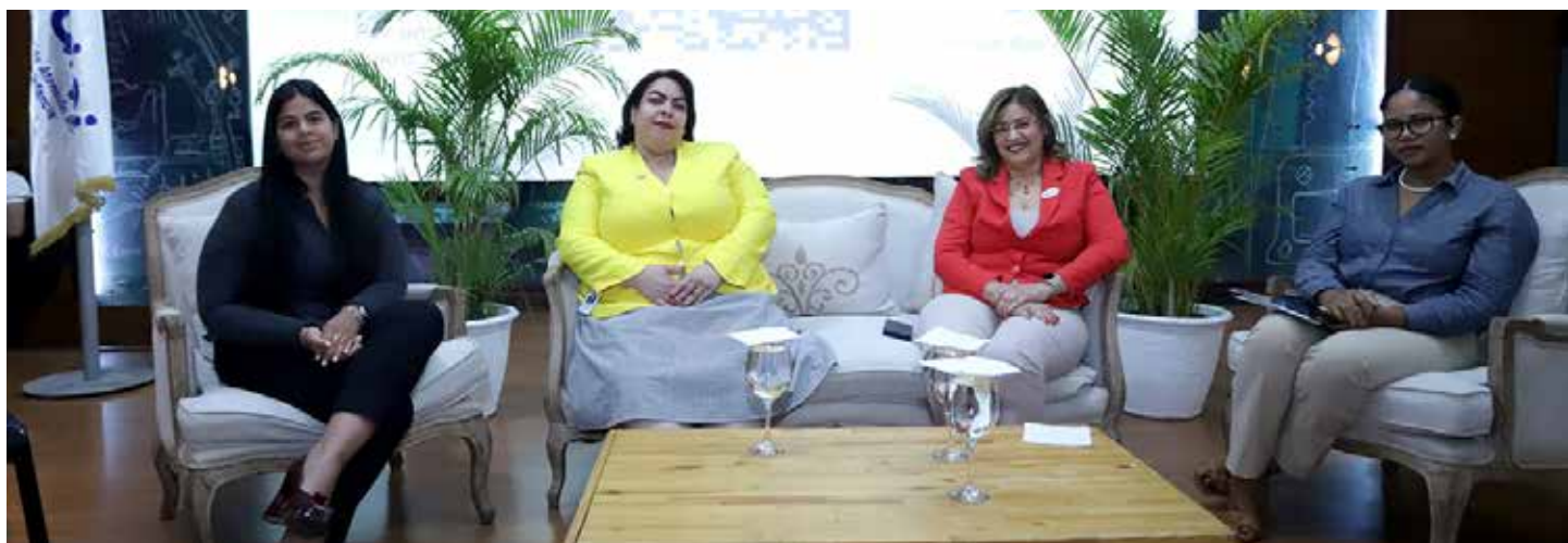
Expositoras del panel incluidos y protegidos.

El Instituto Nacional de Atención Integral a la Primera Infancia (INAIPI) culminó la Jornada de Prevención ante el Abuso Infantil 2023 “Por una Infancia Incluida y Protegida”, con un panel en el cual se promovió los derechos de los niños y de las niñas y los procesos de inclusión en redes comunitarias.