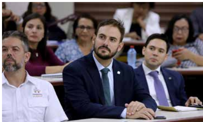
Momento del segundo día del foro.