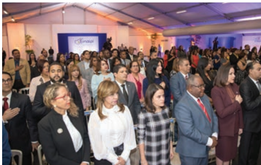
Vista parcial de los participantes en el acto de inauguración del Seminario.

sobre el estado actual y los avances de las políticas de atención y la garantía de derechos de la Primera Infancia en América Latina, a fin de asumir modelos de éxitos que puedan ser ejecutados en el país.