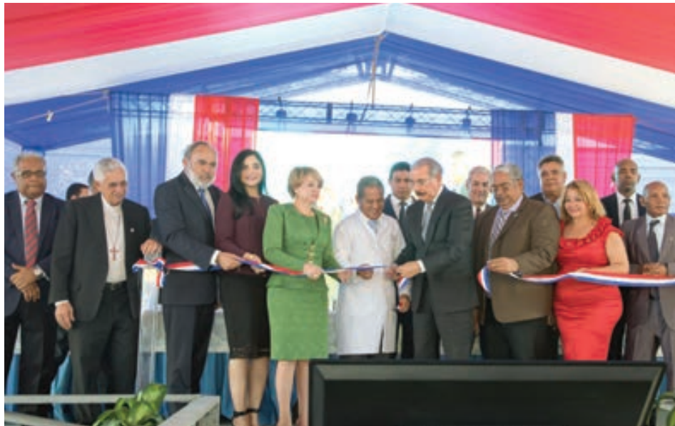
El presidente de la República, Danilo Medina, hace el corte de la cinta para dejar inauguradas las obras en la provincia de San Juan.

obra, que beneficiará a 226 niños y niñas, y sus familias, ya son 61 centros bajo este nuevo modelo en todo el territorio nacional.