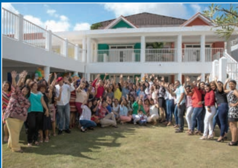
Colaboradores de la Red de Servicios Los Ríos, en el Distrito Nacional, disfrutan su encuentro navideño.

En este encuentro además de degustar un típico almuerzo navideño, también fueron reconocidos con certificados los colaboradores que realizan su labor de manera sobresaliente al momento de cumplir su rol.