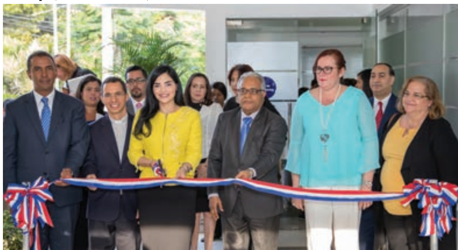
La directora del INAIPI, acompañada por el ministro de Salud Pública, la ministra de la Mujer y el Director General de DIGEPEP, hace el corte de cinta para la inauguración de la sala de lactancia de la Sede Central.

jaron inaugurada y totalmente equipada la "Sala Amiga de la Familia Lactante" de la sede central de la institución, la cual beneficiará a una decena de colaboradoras madres que en la actualidad están lactando.