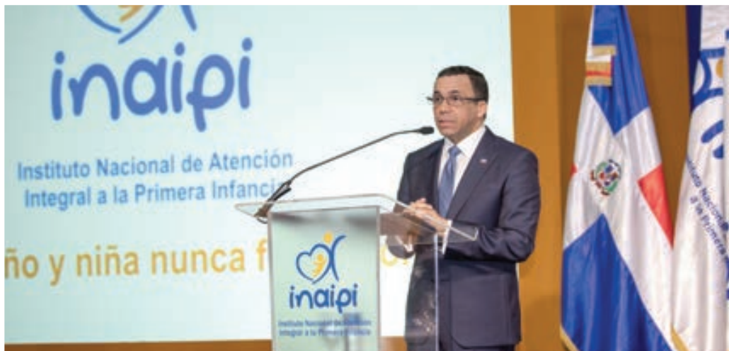
El ministro de Educación, Ara. Andrés Navarro, pronuncia el discurso central del acto de inauguración del Seminario.